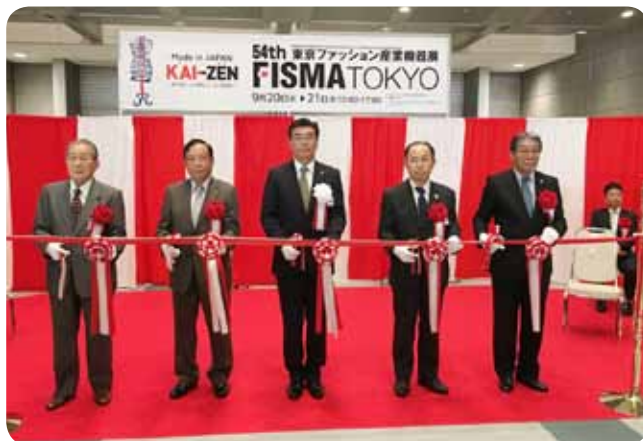
開会式テープカット