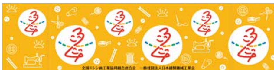
テーブルスカート(270cm×70cm)