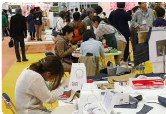
〈ホームソーイングゾーン〉