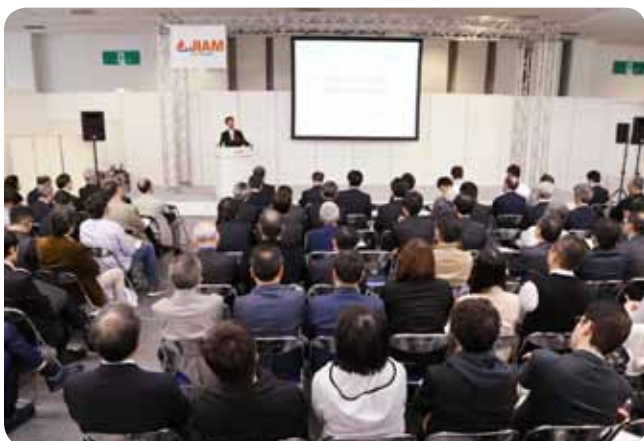
〈特別企画セミナー〉