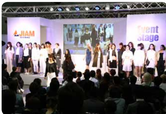
〈ファッションショー・コンテスト〉