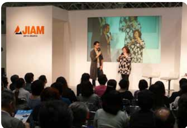
〈スペシャルトークショー〉